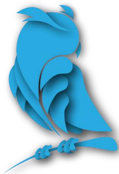
Рис. 1 Оформление рисунков и иллюстраций. Рисунки только в формате .jpg

В основе современных исследований лежат фундаментальные понятия. Эти понятия базируются на нескольких составляющих... [1].